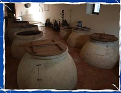
MUSEO DEL ACEITE HOJIBLANCA. ANTEQUERA